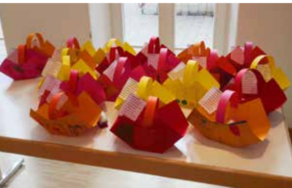
Erntedankkörbchen gebastelt im KiGo